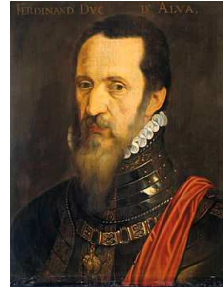
Ferdinand Alvarez de Toledo, hertog van Alva

Als Philips de II op de hoogte gebracht wordt wat er zo in de Lage landen plaats vindt, dan stuurt hij de Hertog van Alva op 5 april 1567 met een leger naar Nederland om orde op zaken te brengen. Op het harnas van Alva staan twee afbeeldingen gegraveerd. Op een van deze afbeeldingen zien we Alva geknield bij het kruis met Jezus. Hij beloofd Jezus de ketters in Holland een lesje te leren en de afvalligen te doden.