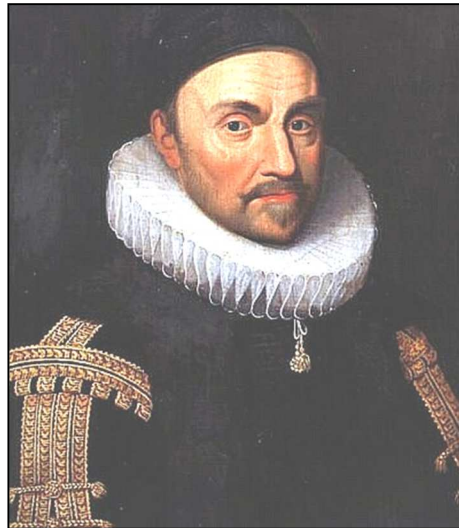
Willem I van Oranje 1533-1584