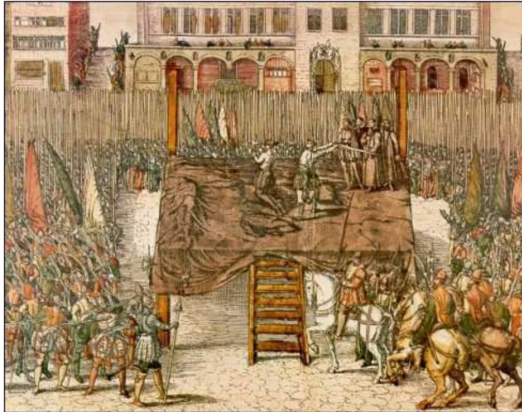
Onthoofding op de markt van Brussel van graaf van Egmond en graaf van Horne 5 juni 1568

Alva komt op 22 augustus 1567 aan in Brussel. Hij stelde een Bijzonder Gerechtshof in, de zogenaamde Raad van Beroerten . Dit gerechtshof werd door het volk al snel Bloedraad genoemd. Niet voor niets: naar schatting werden er 6.000 tot 8.000 protestanten door de Raad van Beroerten veroordeeld. De graven Van Egmond en Horne worden als voorbeeld onthoofd op de markt van Brussel.