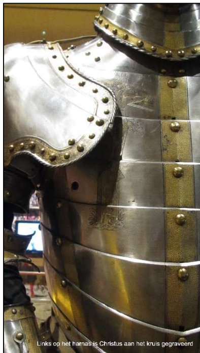
Harnas van Alva

Eerder schreef ik dat Willem van Oranje pas in verzet kwam tegen Koning Philips de II, nadat zijn zoon prins Philip Willem, in het voorjaar van 1568 werd ontvoerd door Philips de II. Met zijn verzet begon de 80 jarige oorlog op 23 mei 1568 en eindigde op 15 mei 1648.