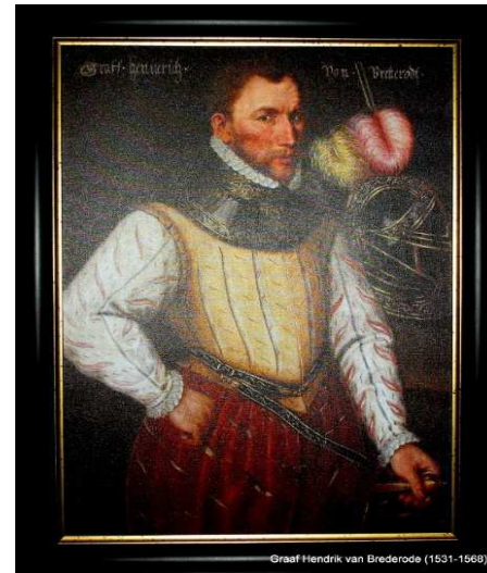
Hendrik van Brederode 1531-1568