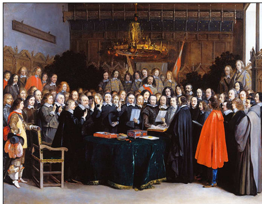
Spaanse en Nederlandse onderhandelaars