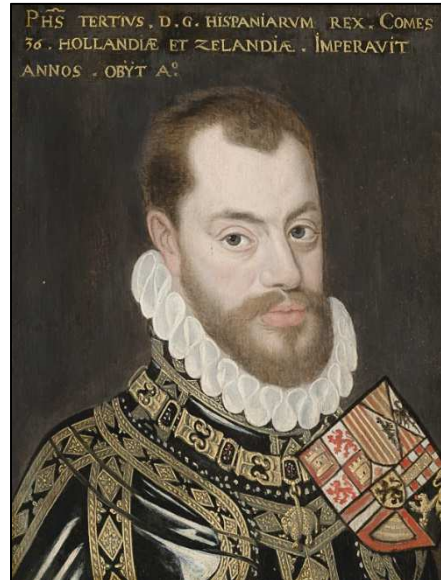
Philips de II heer van Nederland 1527-1598