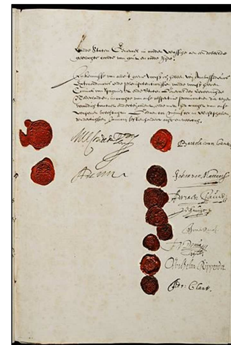
Laatste folio van het verdrag

In Munster werd op 15 mei 1648 de vrede gesloten tussen Spanje en de Republiek der Verenigde Provinciën, hierdoor kwam een einde aan de tachtig jarige oorlog. Het verdrag beslaat 40 folio's, waarvan de laatste hierboven is afgebeeld, met daarop de handtekeningen en cachetten van de onderhandelaars.