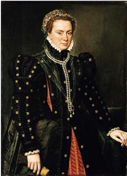
Margretha van Parma 1522-1586