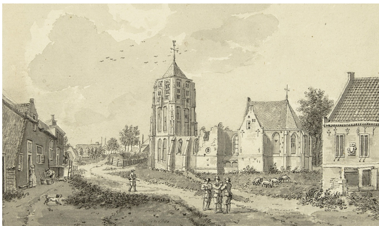
NH kerk van Acquoy en Schepenhuis 1784 tekening van Herman Petrus Schouten

De eerste vermelding van Acquoy komen we tegen in het jaar 1305 en wordt dan vermeld als Eckoy. De naam zou dan kunnen komen van het ooi van Heer Ekko. Maar andere historici willen de naam verklaren met "aqua" = water en "ooi" = laag (drassig land).