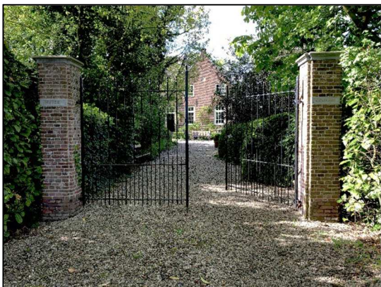
Ingang via Lingedijk