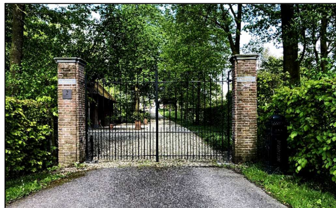
Ingang via Nieuwe Steeg

De eigenaar van het Huis Acquoy, waar de burcht gestaan heeft, gaf het Huis Acquoy aan een leenman. Deze leenman inde de inkomsten uit de Heerlijkheid van Acquoy. De lenen waren erfelijk en meestal erfde de oudste zoon deze. Bij elke vererving moest deze leen door de leenheer goedgekeurd worden. De heerlijke rechten die de leenman had waren o.a. het tiendrecht, vis en jachtrecht, verhuur van de korenmolen, veer en tol rechten en hij had het recht van wind. De meeste rechten bleven aan de heerlijkheid verbonden en gingen steeds over op de nieuwe heer. Verder had de leenheer (baron) collatie recht, het recht om een dominee te benoemen. De bewoners werden Heere en Vrouwe van Acquoy genoemd.