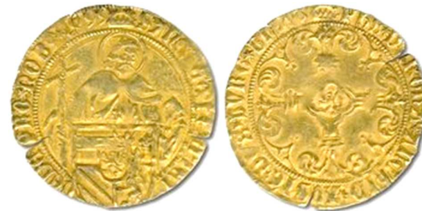
Philippus gouden gulden