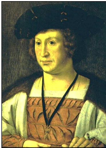
Floris van Egmond graaf van Buren, heer van Acquoy

sijnen vrijheden als tienden van biistin (beesten) cijns (belasting) en der ghetijcken als dat van outs gheweest is noch die boomgaert duijffhuijs dat riet plickskin en din stin hovi also groit en also cleijn als dat daer gheleghe is alle dit voerschreven goet the ghebruijken met alle 't gheen hij daer op vijnt sonder alleen 't vourse goet niet te verminderen noch the vererghen alle dinck sonder arch off list ewilick (eweleck, eeuwig) ende erflijck (in eigendom) voir seshien gauwen hollansche phs (Philips de Schone) gulden jairs off vijf en twijntigh hollandse stuijvers voir elck phs gulden off pajement (afbetaling) huere weerden daer die eerste doch van bethalinghe off wesen sal sinte peters ad cathedram (29 juni) nu naest comede en so voirt van jaer tot jaer vervolghende daer boven dese goeden naest geleghen sluijs (waar Acquoy begint) campen ende waert ghelegghen eghenedigh heere veirthien hont lands noch vijf halve merghe lands noch vierhalve merghe lants beneden westwaerts naest ghelegghen die ghemeijne steghe (Nieuwe Steeg) en suijtwaerts streckende den linghen dijck noch so sijnt voirwaerden dat wij altijd die plaets houwen (?) sullen daer nu ten tijt onsse rosmolen op staet onbeswaert van ijimants want wij floris van egmont willen dat allen (?) vant en ghestedich wesen sall so hebben wij onsen seghel hier onder aen desen brief ghehanghen op the tweede dagh in februario anno vijftien hondert twijntich